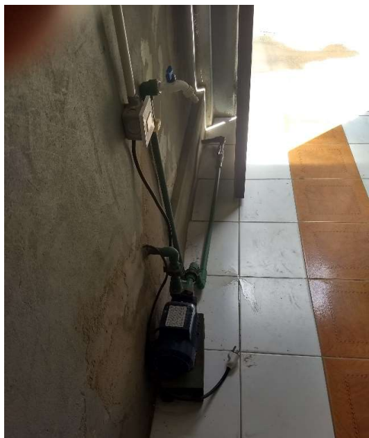
Figura 1. Canilla de Pasillo próxima al ingreso a la vivienda Manzana 24 Casa 98