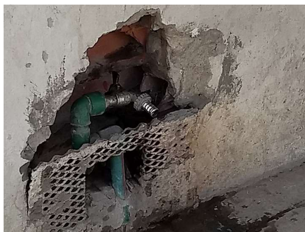
Figura 2. Canilla de acceso público ubicada sobre Osvaldo Cruz próxima a la intersección con la calle Lavarden